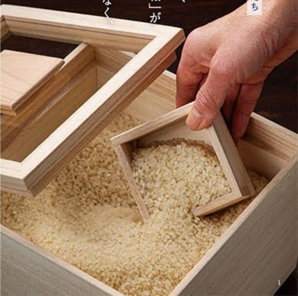
90年以上継承される「増田桐箱店」

培われた 技術と伝統を継ぎ、 作り続けられる「箱」が 持つ機能美は、 主役を守るだけでなく 人と物に寄り添い 心を豊かにする